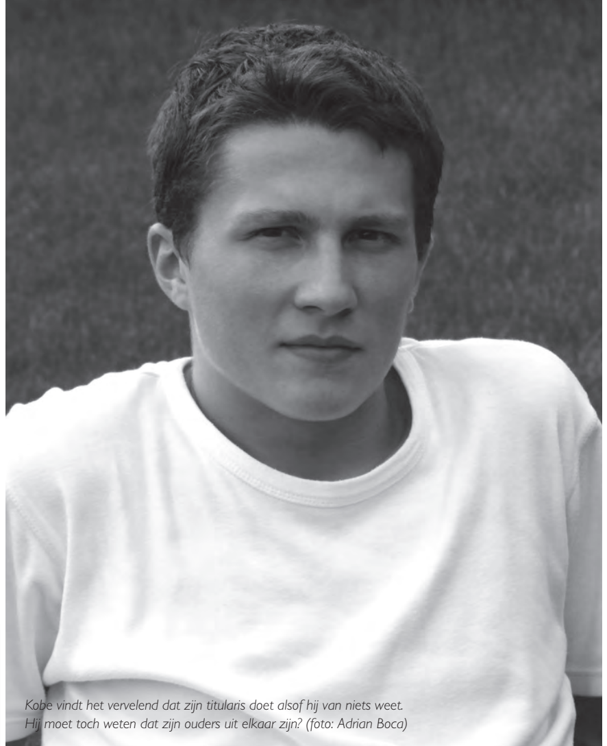
Kobe vindt het vervelend dat zijn titularis doet alsof hij van niets weet. Hij moet toch weten dat zijn ouders uit elkaar zijn?

Ook op klasniveau kan de leerkracht van belang zijn voor kinderen die met scheiding te maken krijgen en/of in nieuwe gezinsvormen leven. Als leerkrachten tijdens de les aandacht hebben voor allerlei gezinsvormen, hoeft het kind zich