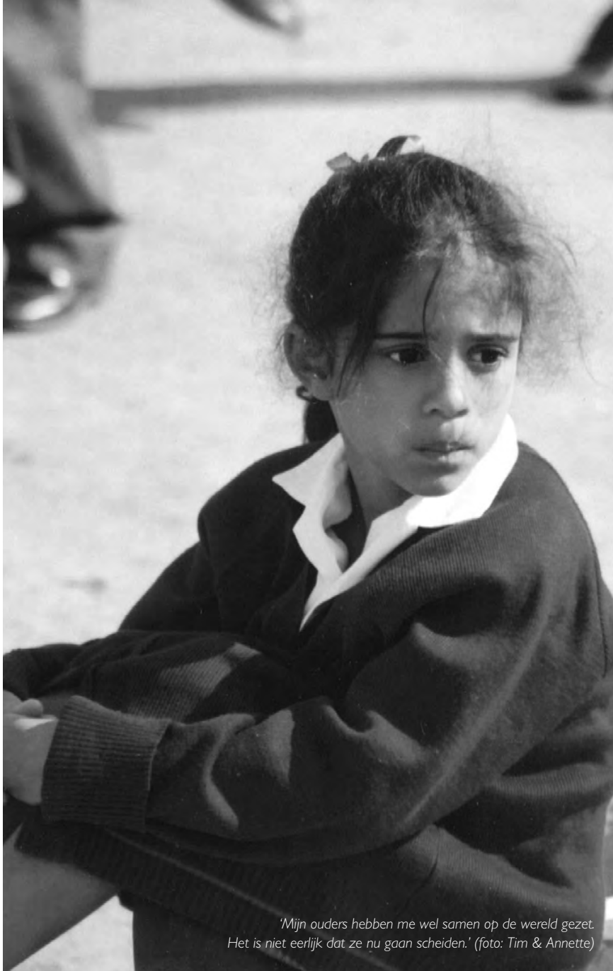
'Mijn ouders hebben me wel samen op de wereld gezet. Het is niet eerlijk dat ze nu gaan scheiden.'

uitdrukkelijk dat ze niet verplicht zijn om deze informatie te geven, maar dat het voor de school helpend kan zijn om de situatie van het kind in perspectief te hebben. Maak aan ouders duidelijk dat het in het belang van het kind is om de school op de hoogte te brengen als de gezins-situatie verandert.