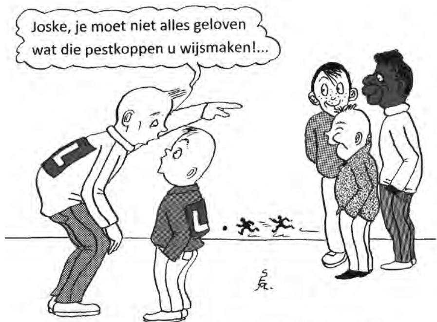
Leerling-monitoren van de hogere jaren, waaronder ook anderstalige nieuwkomers, krijgen de kans om activiteiten voor de eerstejaars te begeleiden ...

Deze hefboomen zijn er altijd al geweest: van bij de bouw van de eerste school werden activiteiten voorzien, moest er toezicht zijn, werden regels en afspraken gemaakt, was de infrastructuur mee bepalend voor de organisatie van de school en ook voor de sociale interacties die ze uitlokt. Belangrijk is wel dat de concrete invulling van deze vier elementen beïnvloed wordt door maatschappelijke tendensen, zoals etnisch-culturele diversiteit en superdiversiteit.