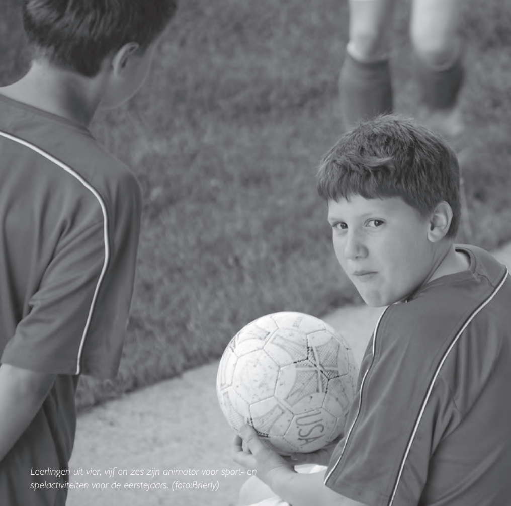
Leerlingen uit vier, vijf en zes zijn animator voor sport- en spelactiviteiten voor de eerstejaars.