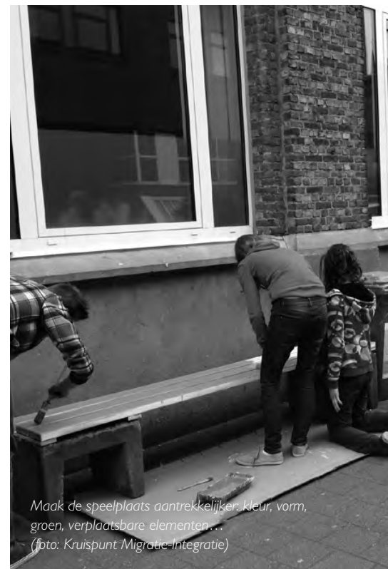
Maak de speelplaats aantrekkelijker: kleur, vorm, groen, verplaatsbare elementen...

Al onze voorstellen zijn gelinkt aan GOK-thema's die voor scholen een houvast zijn om hun beleid uit te stippelen. 4