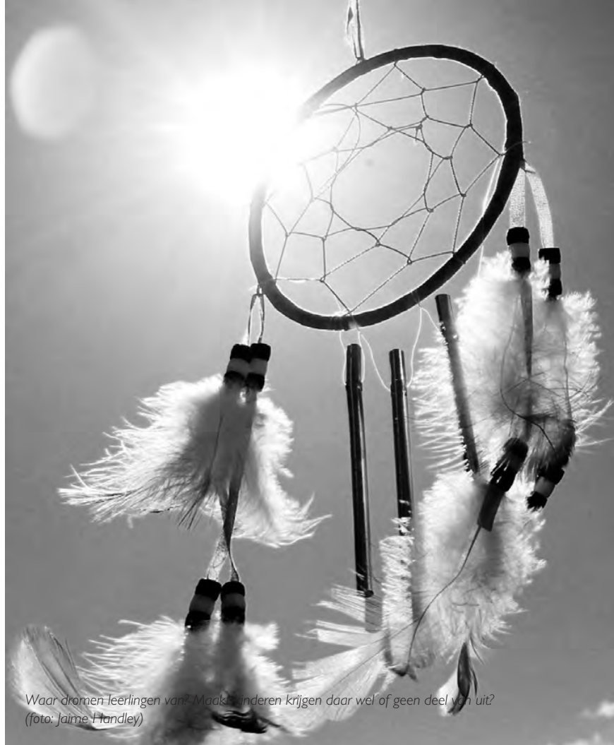
Waar dromen leerlingen van? Maak anderen krijgen daar wel of geen deel van uit?

De regie van de ketenaanpak ligt bij één centraal persoon. Hij bewaakt het overzicht van de verschillende vormen van ondersteuning rond de zwangere leerling en haar partner. Deze centrale persoon is idealiter ook iemand waarbij de leerling zich goed voelt en terecht kan voor een vertrouwelijke babbel. Deze rol kan soms ingevuld worden door een CLB-medewerker, die sowieso een draaischijffunctie bekleedt en een netwerk vormt met de diensten in de regio die ondersteuning kunnen bieden. Aandachtspunt hierbij is dat de centrale persoon beschikbaar blijft voor de jongere, ook op lange termijn. Het gaat immers niet alleen om doorverwijzing, maar over het opnemen van een bewust engagement, eventueel op lange termijn. Dit is een aspect dat goed besproken moet worden door de verschillende partners. Bij verandering of beëindiging van school (en dus ook CLB) moet een zeer goede overdracht gebeuren, liefst in bijzijn van alle partners. Neemt het CLB naast de draaischijffunctie ook het engagement op lange termijn op of doen we daarvoor beroep op iemand anders? Wie neemt wat op en hoe wordt er gecommuniceerd?