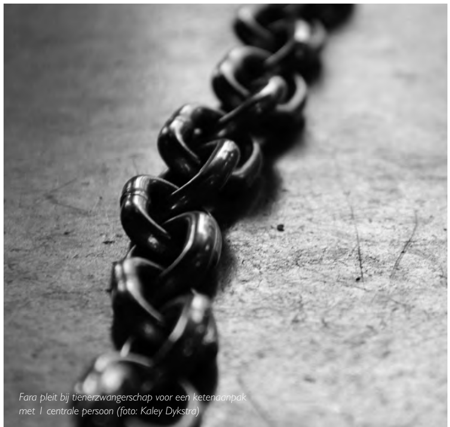
Fara pleit bij tienerzwangerschap voor een ketenaanpak met 1 centrale persoon

Bij de begeleiding van ongeplande zwangerschappen pleit Fara voor een 'ketenaanpak', waarbij verschillende partners samenwerken op verschillende domeinen om de jongere(n) te ondersteunen. Het doel is om te komen tot een constructieve en vlotte samenwerking