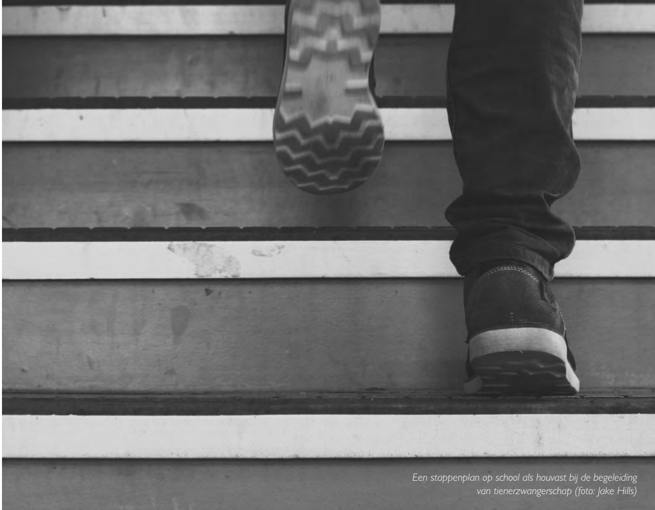
Een stappenplan op school als houvast bij de begeleiding van tienerzwangerschap