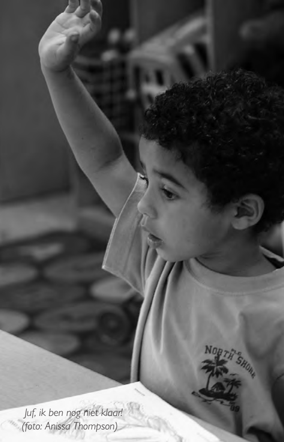
Juf, ik ben nog niet klaar!