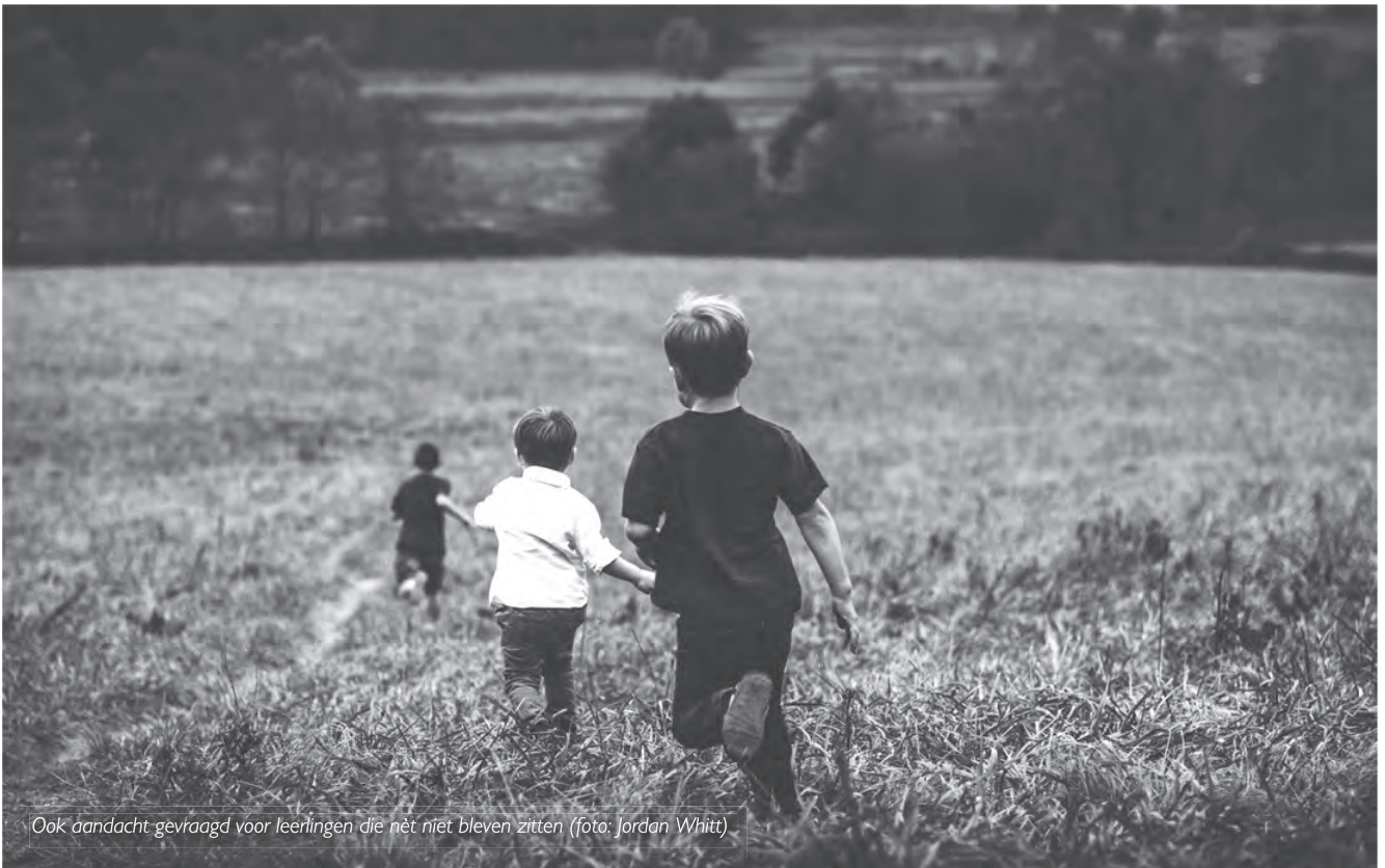
Ook aandacht gevraagd voor leerlingen die net niet bleven zitten