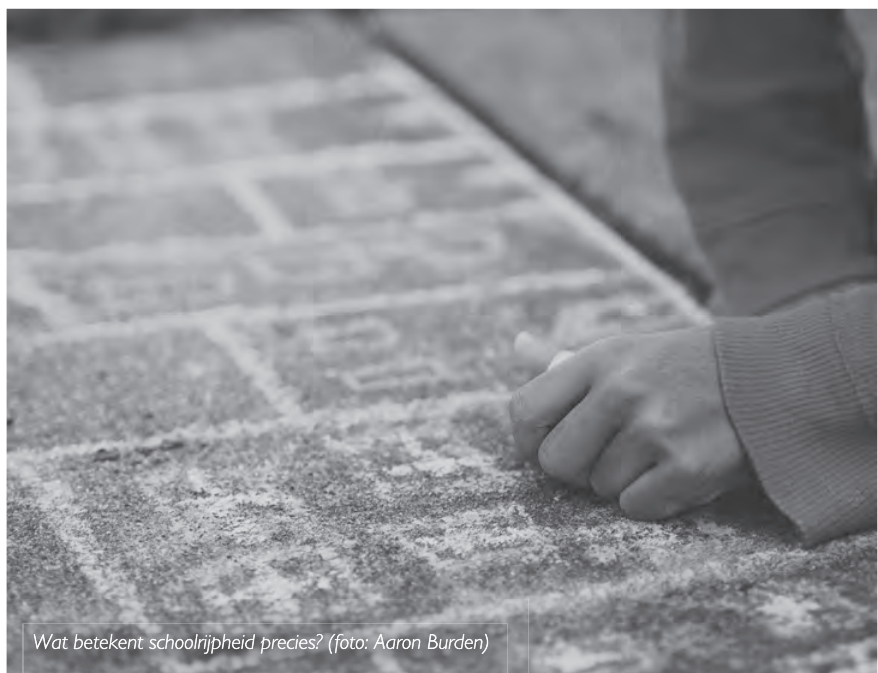
Wat betekent schoolrijpheid precies?

Een laatste richtlijn heeft betrekking op de vaststelling dat kinderen die net niet blijven zitten een belangrijke risicogroep vormen om later te blijven zitten. Echter, gezien deze leerlingen toch doorgaan naar het eerste leerjaar, wordt hun problematisch dossier wel eens vergeten.