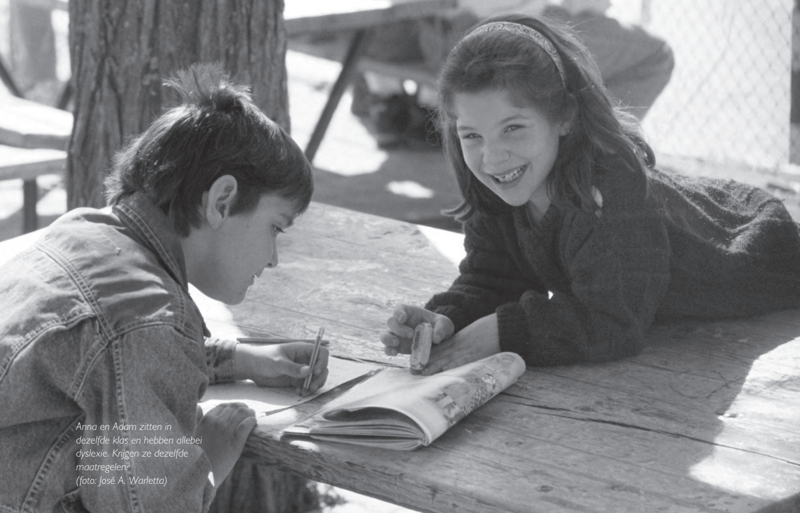
Anna en Adam zitten in dezelfde klas en hebben allebei dyslexie. Krijgen ze dezelfde maatregelen?