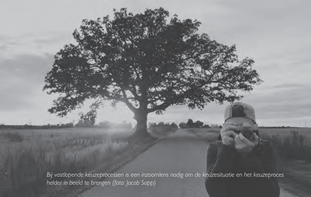
Bij vastlopende keuzeprocessen is een inzoomlens nodig om de keuzesituatie en het keuzeproces helder in beeld te brengen